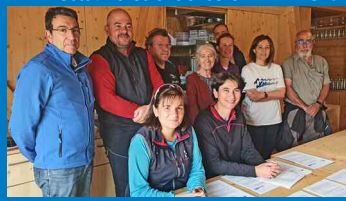
Partenariat des sites Cévennes / Andorre