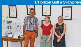
Nouvelle saison à Micropolis

Amis abonnés, l'équipe de la Lettre T vous souhaite une excellente saison 2019 et vous donne rendez-vous vers le 15 septembre.