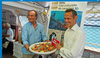
Sète / Barcelone avec la RENFE - SNCF