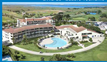
L'Horizon Golf à St-Cyprien