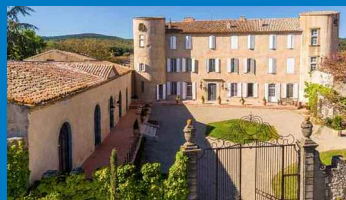
Le Château de Villerambert