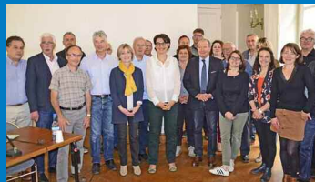
L'AG de "Lozère Tourisme"