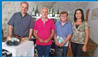
L'OT Cévennes Cèze lance la saison