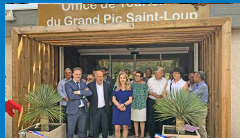
Inauguration de l'OT du Grand Pic St-Loup